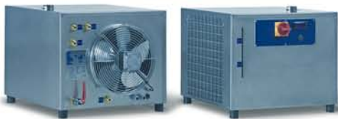
Typ RK 1, RK 3 und RK 4