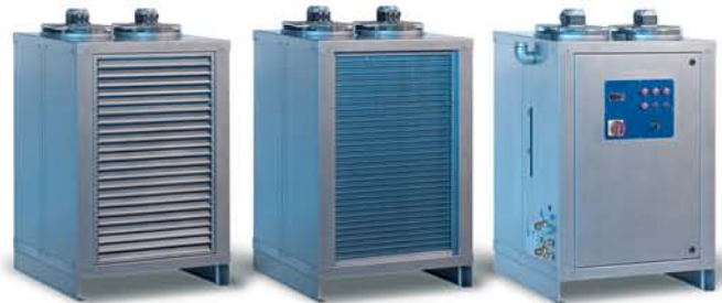
Typ RK 5 und RK 7